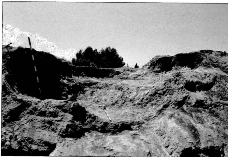
Imatges de l'estructura 7.

d'altres prehistòrics (ceràmica feta a mà i sílex –un trapezi). 22 cms de potència.