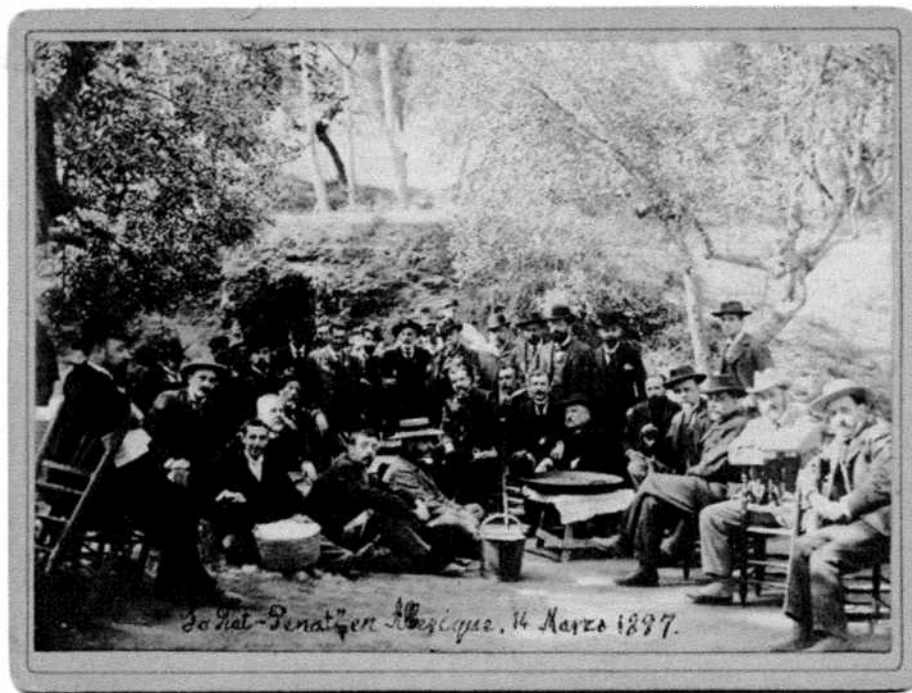
Una altra imatge de Lo Rat Penat a Alberic, el 14 de març de 1897.

Quant a la seua activitat parlamentària, el breu però interessant article de Francisco Sanchis la resumeix així: "Su actuación parlamentaria se desarrolló en campos tan dispares como los presupuestarios, el educativo, el social, el económico. Pero su actuación más relevante y la que presidió la mayor parte de sus intervenciones fue la mejora de las condiciones económicas y sociales de la tierra que le vió nacer; en una época en que la atención gubernamental se centraba en los problemas de Ultramar con la dejación en materia de Fomento, nuestro ilustre paisano consiguió importantes realizaciones contribuyendo a crear esa infraestructura mínima