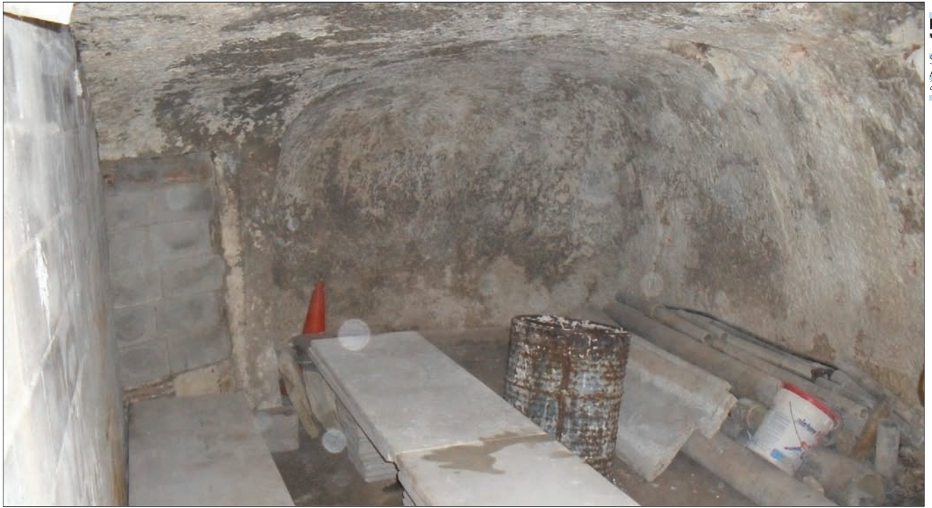
Interior del Refugi del Cubet.