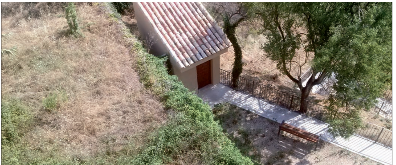
Actual accés a les Coves del Colomer.