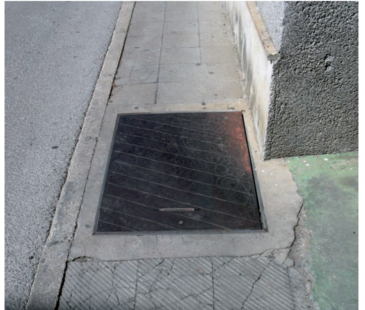
Boca d'eixida del Refugi del Repunxó.