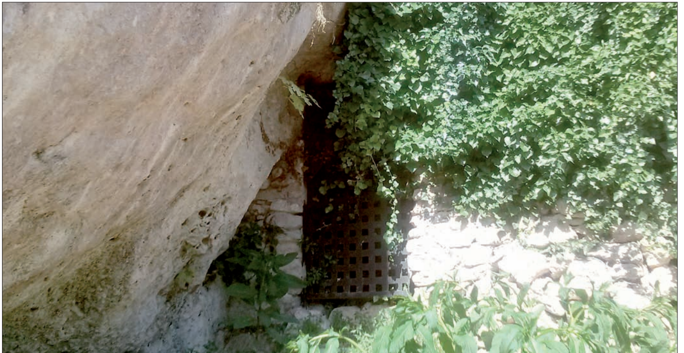
Boca d'eixida del Refugi "Tras la Villa", (Coves del Colomer).