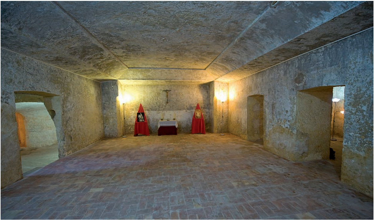
Interior Refugi del Convent Rupestre.

El quart i últim refugi, denominat Tras la Villa, es tracta de les Coves del Colomer, actual Centre d'Interpretació Turística de les Covetes dels Moros. Queda patent perquè està qualificat també d'extraordinària resistència. L'actual carrer Mossén Hilario, que transcorre des de la plaça de l'Ajuntament fins al Pont de Darrere la Vila, era el denominat Tras la Villa. Este refugi era de gran importància donada la gran quantitat de veïns que vivien en el barri medieval. A més, carrers com Abadia o Canterería també acollien a un nombrós grup de refugiats.