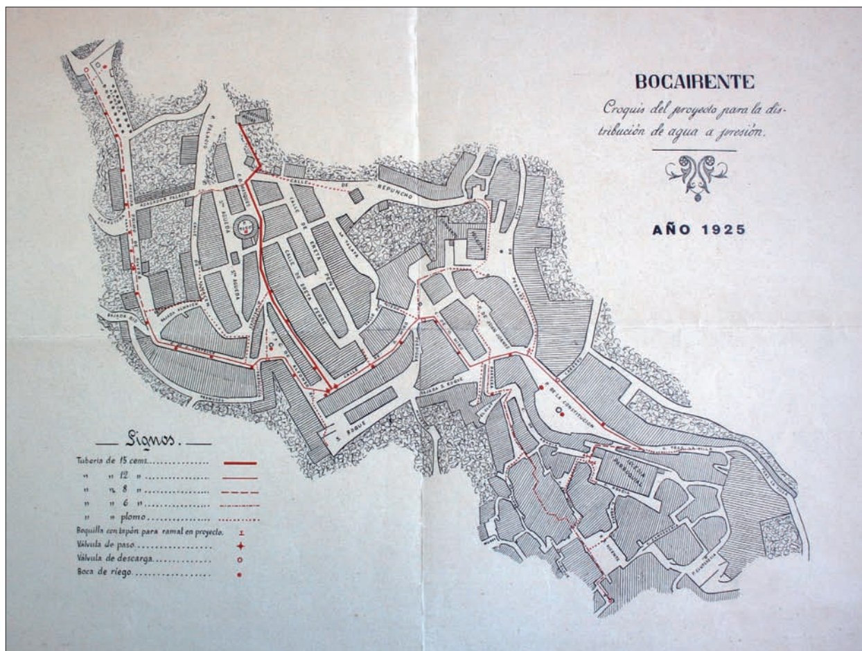
Plànol de 1925.

franquista coneixia l'existència de totes estes infraestructures. No obstant això els avions franquistes sobrevolaven les zones més pròximes al litoral i nuclis més destacats com Xàtiva, Alcoi o Villena, que sí van ser bombardejats. 5