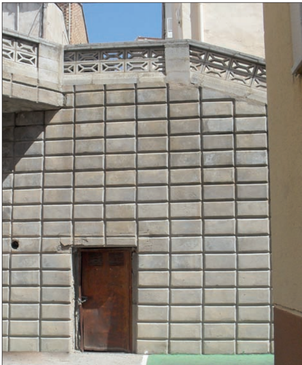
Accés al Refugi del Cubet per Ereta de Ferre.

La població es va preparar per a protegir-se, però no va haver construccions de nova planta. Va recuperar per a això les nombroses coves, repartides per tota la població, especialment en el subsòl del barri medieval. També es van amansir altres refugis públics de majors dimensions: les Coves del Colomer, Monestir Rupestre de les RRMM Agustines, un antic celler, conegut com Cubet i l'extensa xarxa de conducció d'aigües de Bocairent, que connectava la zona industrial amb el centre de la població, el plànol del qual acompanya el treball.