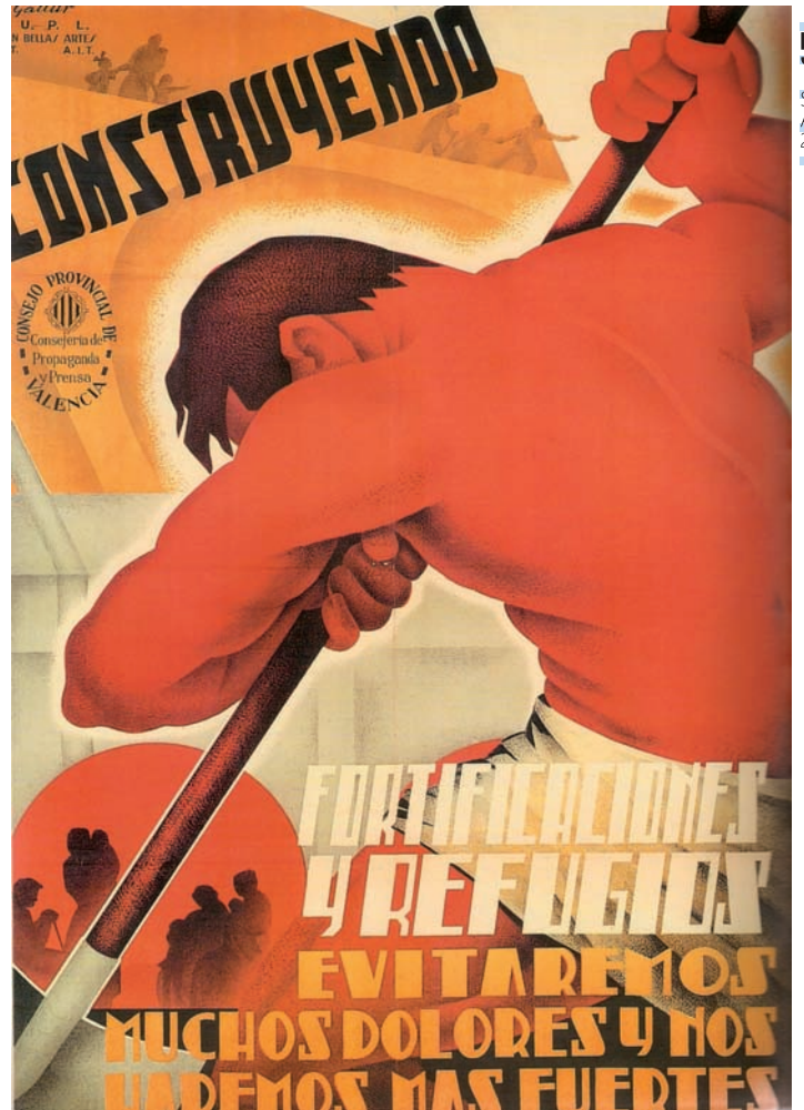
Cartell "construyendo fortificaciones y refugios..."

Estos refugis antiaeris utilitzats per a la defensa passiva de la població són un dels elements que ens permeten estudiar la guerra civil, des de la perspectiva de la rereguarda. L'escassetat de documentació respecte d'això ha fet fonamental recórrer als testimonis orals, atés que les restes materials són poques i han desaparegut gran part de les empremtes. El desconeixement és total per a la majoria de la gent. Tot això ens indica que és fonamental la seua recuperació i conservació per a evitar que desapareguen de la memòria col·lectiva. Respectar-ho i conservar-ho és un compromís i una exigència.