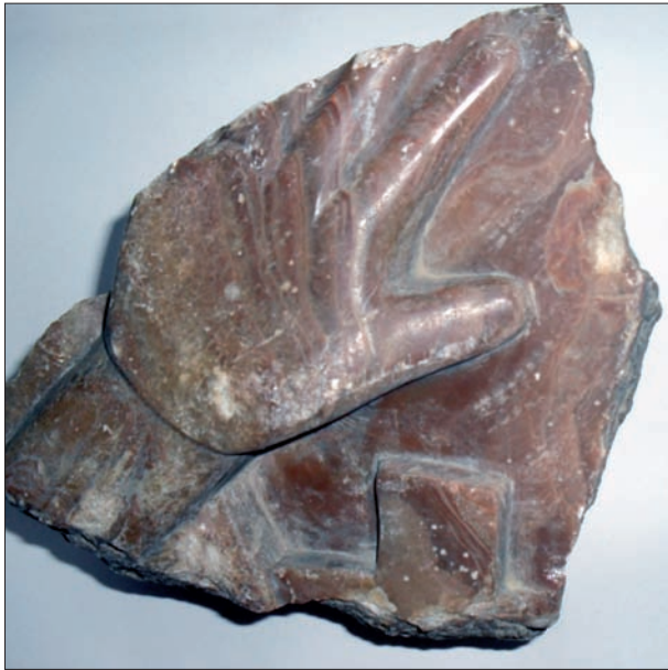
Mà de Sant Francesc, que estava a la entrada del Convent Rupestre.