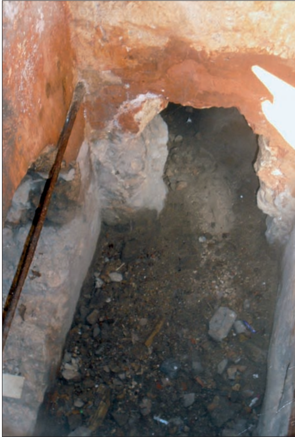
Accés al Refugi del Repunxó.