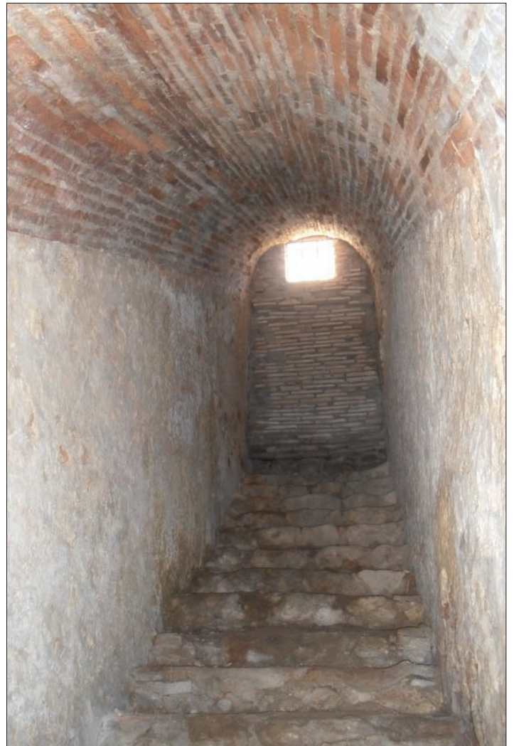
Boca d'eixida del Refugi del Convent Rupestre.

El refugi de les Monges Agustines, qualificat com d'extraordinària resistència, és el recuperat Monestir Rupestre. Dos de les boques eren l'actual entrada de les visites turístiques, des de dins de l'hort i la porta del garatge que hi ha junt a l'escalinata d'accés a l'actual convent. La tercera es tracta d'una escala, situada al fons del monestir, amb eixida a un nivell superior de l'hort, la porta del qual en l'actualitat està tapiada. La seua finalitat era facilitar el poder entrar en dit recinte des de la sala de labor de les religioses, reconvertida en sala de jocs, després de ser confiscat el convent i ubicada allí la Casa del Poble. En les transformació que va patir el convent al ser reutilitzat es va destruir part del seu valor patrimonial, entre ells un magnífic mural d'àgata, que representava a San Francisco i que es situaba en l'eixida al pati des de la mencionada habitació de labor. Es conserva una tros del mural, que representa la mà del sant i de ens aproxima a les dimensions que tindria.