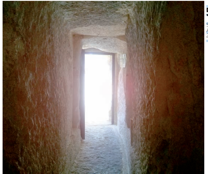
Accés al Refugi "Tras la Villa", (Coves del Colomer).