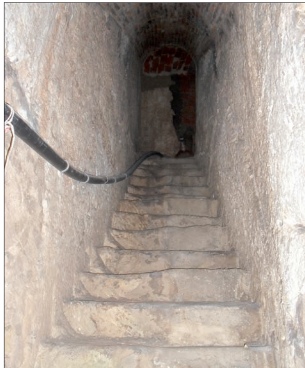
Accés al Refugi del Cubet per Ereta de Peña.

Cubicación. 184 metros Superficie. 184 metros Bocas de salida: cuatro por dicha calle Capacidad 368 personas Resistencia calculada bomba 500kilos No está dotado defensa antigás. No tiene alumbrado, pero puede colocarse en el acto Condiciones sanitarias, buenas Situado dentro de varias calles población.