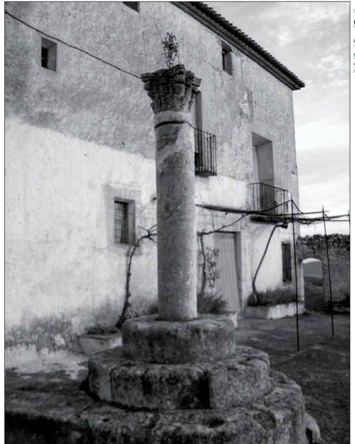
Casa i Ermita del Sant Crist de Bocairent.