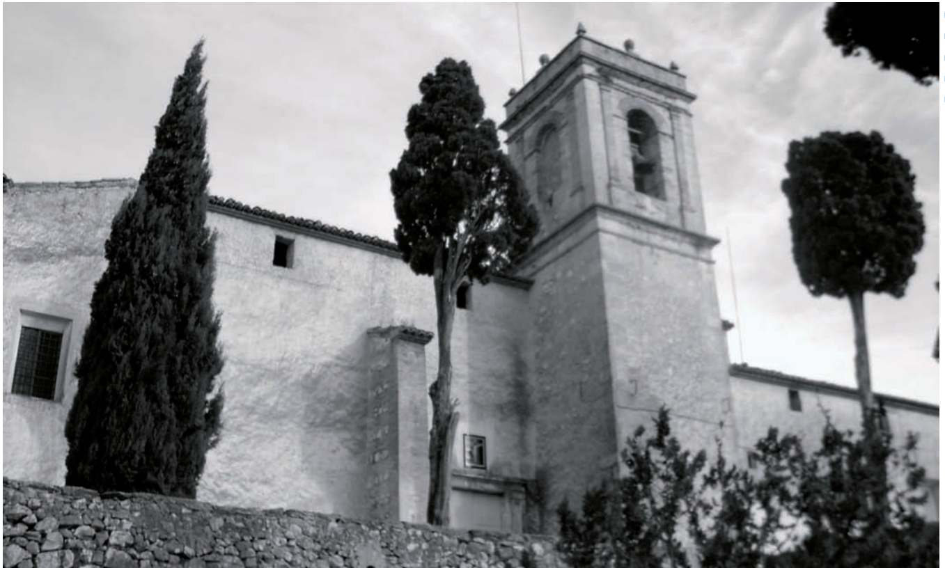
Ermita del Sant Crist de Bocairent.

És, per tant, un aspecte de la religiositat bocairentina del qual ens haurem d'ocupar en una altra ocasió per tal d'analitzar algunes qüestions com el seu mode de vida, el caràcter quasi exclusivament local de les beates a diferència de la procedència diversa de les agustines, les semblances i diferències entre les emparedades del Calvari i les beates de Sant Francesc, la relació d'aquestes amb la parròquia i el convent recol·lecte local, l'existència anterior d'algunes beates dominiques, etc.