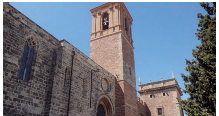
Monestir d'El Puig de Santa Maria.

En canvi, més endavant, en els anys 1687 i 1695, es van signar sengles concòrdies entre el Capítol del clergat i el Consell de la vila, que van determinar el futur del santuari. Entre d'altres coses, es va acordar que, de manera perpètua, un prevere havia de residir a l'ermita, el qual era triat pels jurats bocairentins entre els dos candidats que proposava el clero, i no podia ser remogut, i que l'Ajuntament es feia càrrec de les despeses i del pagament de la còngrua del capellà, qui assumia les funcions de majordom de la casa i el santuari i pagava l'ama (que havia de ser major de quaranta anys) i els ermitans (criats). A més, el Consell local va assumir el compromís de concloure l'obra de la cisterna que havia iniciat i de fer l'habitatge del vicari, ama i criats “para que en breve se pueda conseguir una casa desente, con ella aumentar las limosnas y veneración del Santo Cristo” . 14 Començaven, per tant, uns altres temps per a la casa i l'ermita, sempre ja, però, sota la tutela de la parròquia.