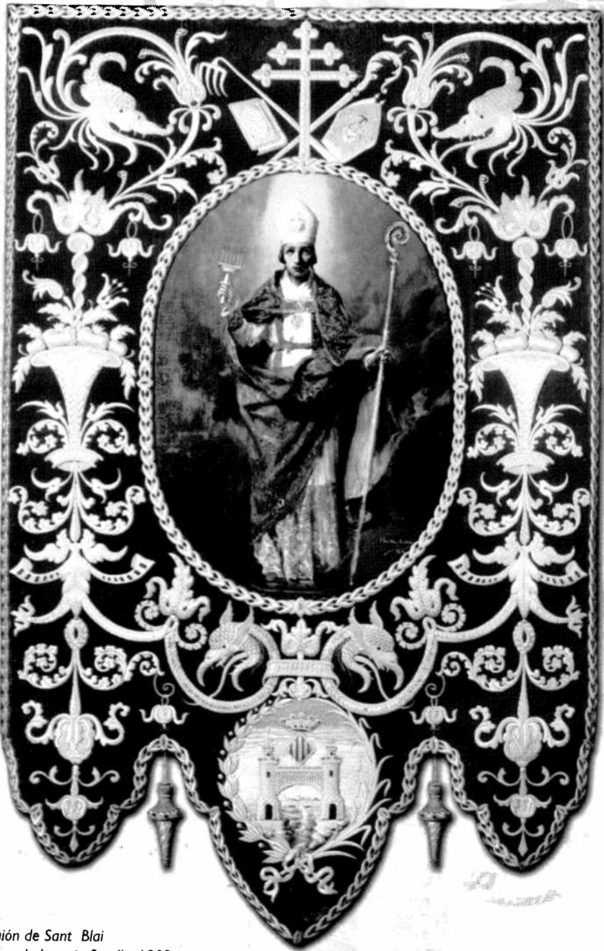
Guión de Sant Blai Obra de Joaquin Sorolla, 1902