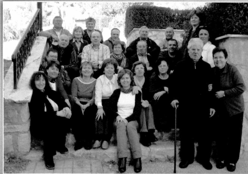
Majors de Santa Bàrbara, any 2010. Mayores de Santa Bàrbara, año 2010.