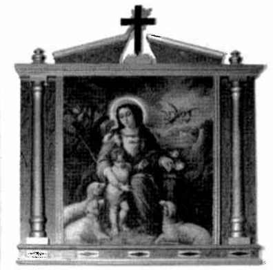
Quadre de la Divina Pastora de la Serra Mariola, any 1945. Autor: F. Climent. Cuadro de la Divina Pastora de la Sierra Mariola, año 1945. Autor: F. Climent.

en direcció a l'Ermita de Sant Tomàs fins a arribar al límit del terme, en les proximitats de el "Mas dels Arbres", retornant per la part oposada o sud del terme municipal bocairentí, en direcció a l'Ermita de Guilella, arribant fins a el "Mas de Buscarrò"; i els voltants del Cementeri de Banyeres de Mariola retornar a l'Ermita de Santa Bàrbara una altra vegada, per a passar al costat d'ella i acabar el recorregut per la Mariola en el "Maset de Mossén Gregori", (en alguna època Ermita de Sant Blas). Des de "Mossén Gregori", proper a la famosa "Coveta de la Sarsa", s'iniciava l'itinerari corresponent a la vall de Bocairent, seguint de mas en mas l'adreça cap a l'Ermita de Sant Jaume, continuant per la part de l'ombria cap a l'Ermita de Sant Antoni de Pàdua fins a arribar a el "Poblet dels Ferres" i des d'allí, o millor desde "Els Cases de la Banyesa" retornar per la part solana de la vall, en direcció a Bocairent i sense entrar al poble, continuar cap a l'Ermita de Sant Antoni Abad continuant cap a "els Alborets" fins a retornar a l'Ermita de Santa Bàrbara.