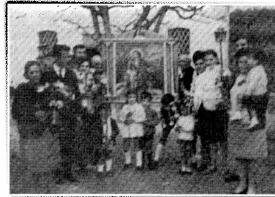
Grup de fidels acompanyant el quadre de la Divina Pastora de la Serra Mariola. Grupo de fieles acompañando el cuadro de la Divina Pastora de la Sierra Mariola.

A grandes trazos el itinerario seguido era el que venia especificado en una libreta, la qual contenia la relació de las masías, y que acompañaba a la iconografía. De él podemos decir en síntesis qué, primero tenía lugar un recorrido por las masías de la sierra Mariola, el cual podemos imaginar a base de la figura de una elipse, en cuyo trazado resultarían los focus de las Ermitas de Santo Tomás de Villanueva (Racò del sirer) y de las damas catequistas (Ermita de Guilella). Y a este le seguía otro similar por el valle de Bocairent, cuyos focus fueran las Ermitas de San Antonio de Padua y San Antonio Abad. Especificando mejor lo anterior hay que decir que, la Ermita de Santa Bárbara está situada en la intercesión de la elipse, con el eje menor en el norte de la Mariola; pues bien, desde ella, de masía en masía, era traslladada la Divina