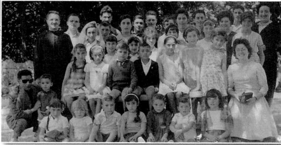
Grup de xiquets de catecisme, anys 60. Grupo de niños de catecismo, años 60.