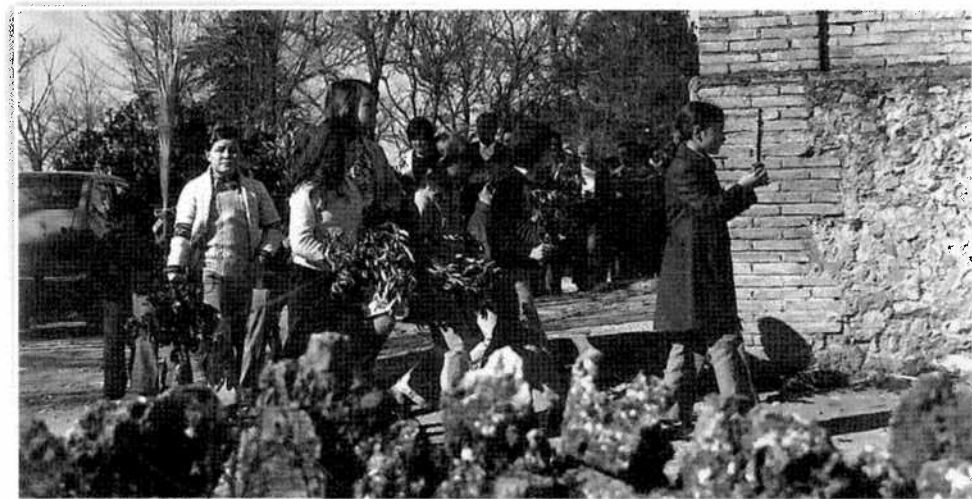
Processó de Rams, any 1975. Procesión de Ramos, año 1975.