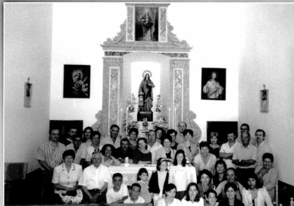
Descendants familia Bodí Blasco, any 2002. Descendientes familia Bodí Blasco, año 2002.

Los Mayores 2010, queremos agradecer a todas las personas que han colaborado en la realización de esta revista, como son los fotógrafos Blai Vanyó y Victoria Asensio Vañó, así como a los familiares que nos han cedido sus fotografías de sus archivos personales y a todos los que se esfuerzan en hacer posible que año tras año se mantenga esta tradición y las vivencias y costumbres del pasado no caigan en el olvido. ¡Muchas gracias!