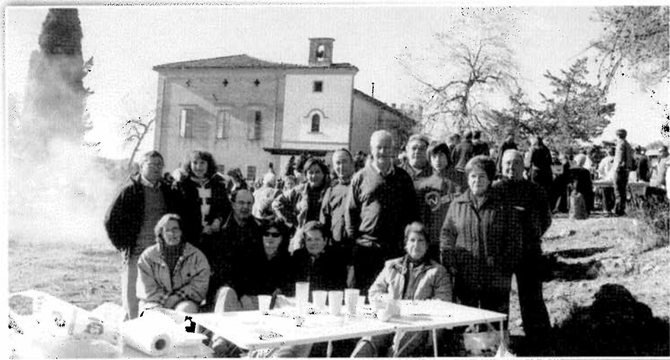
Esmorzar Festa de Santa Bàrbara, any 2009. Almuerzo Fiesta de Santa Bàrbara, año 2009.

Al migdia se celebrava el menjar en les masies, en la qual es reunien les famílies i amics. De la part lúdica de la festa s'encarregava un grup de músics, la rondalla, acordeonista, etc. I hi havia ball en la masia al migdia, a la vesprada, i a la nit. El ball solia estar molt animat, ja que en les dècades dels anys 50 i 60 estaven totes les masies habitades i hi havia molta joventut vivint en elles, a la qual s'unien joves que pujaven de Bocairent i pobles limítrofs. Els homes s'entretenien amb el joc de cartes i les dones en la tertúlia al costat del foc.