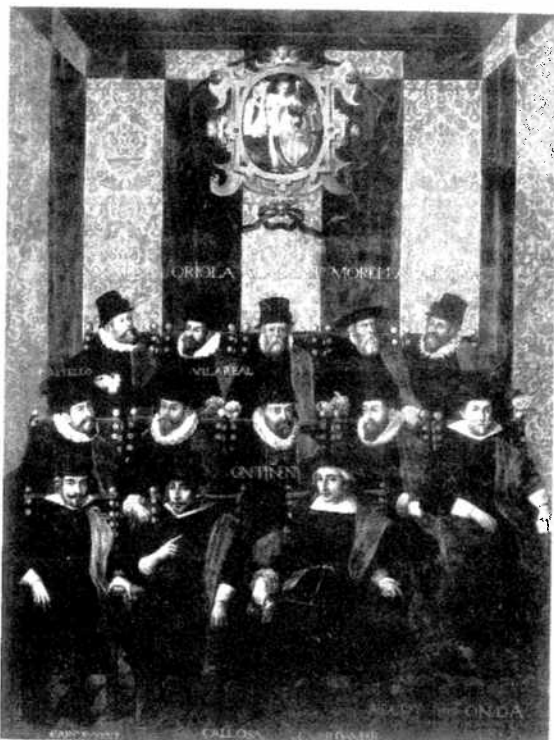
Viles Reials. Palau Generalitat