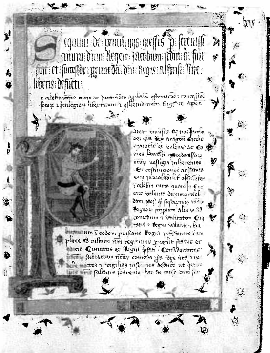
Privilegis Jaume II. Biblioteca Municipal d'Alzira

D. Jaime II para su casamiento con la reina Doña Blanca, se constituyó y estableció que el rey hacía donación a la reina, por razón de sus nupcias, de la cantidad de ocho mil libras de Barcelona, la cual Doña Blanca debía percibir anualmente de ciertos lugares de Aragón, de Cataluña y de Valencia. Las villas y lugares asignados a dicha Reina en el Reino de Valencia, fueron los siguientes: Morella, con sus alquerías; Sagunto, Alcira, Liria, Gallinera, Corbera, Castellón de Burriana (llamado hoy de la Plana), Madrona de Canas, Mijares, Cullera, Onteniente i Bocairente; de cuyos lugares hace el rey donación a Doña Blanca, su esposa, para que los tenga, posea y disfrute pacíficamente durante toda su vida, en concepto de donación por las nupcias”.